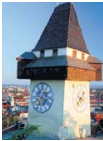
Wahrzeichen Der Uhrenturm auf dem Schlossberg