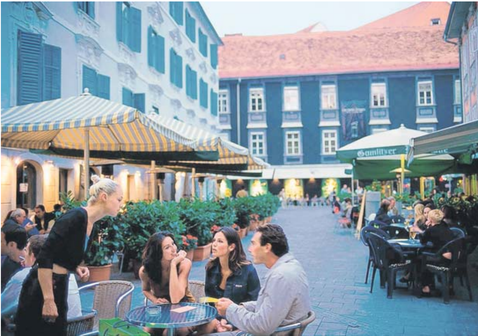
Treffpunkt Das „Bermudadreieck“ mit Restaurants, Bars und Cafés gilt als die beliebteste Adresse für Tag- und Nachtschwärmer in Graz

Das Land liefert die Zutaten, die Stadt tischt auf. Deren Gäste schwelgen in den Spezialitäten aus der Steiermark. Sie erleben einen Gaumenschmaus von Kürbiskernöl bis zum Tafelspitz.