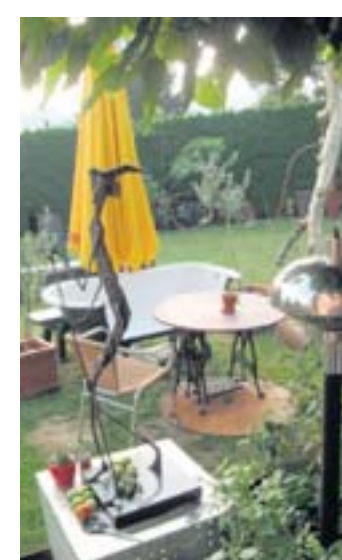
Originell Garten des Restaurants „Malerwinkel“